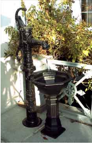
NHP-01 schwarz Kleine Handswengel- pumpe aus Gußeisen.