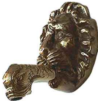
NWH-21 Renaissance Auslauf (Auslauf ohne Ventil)