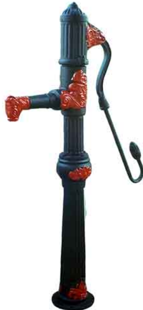
NHP-02 schwarz/rot Große Oldtimerpumpe aus Gußeisen. Maximale Ansaughöhe ca. 8 Meter.