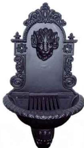
NWB-04 schwarz Nicht geeignet zum Einbau eines Wasserhahns - ggf. Wandeinbauventil anbringen.