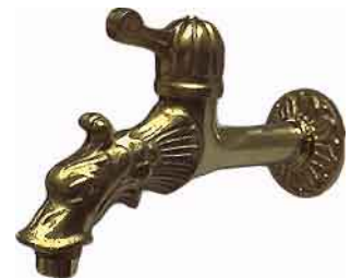
NWH-03 Drachen-Hahn mit Hebel- ventil