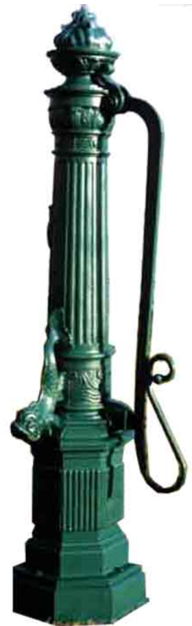
NHP-03 tannengrün Große Oldtimer-Dorf- pumpe aus Gußeisen.