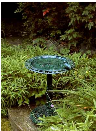
Vogeltränke VT-1 grün