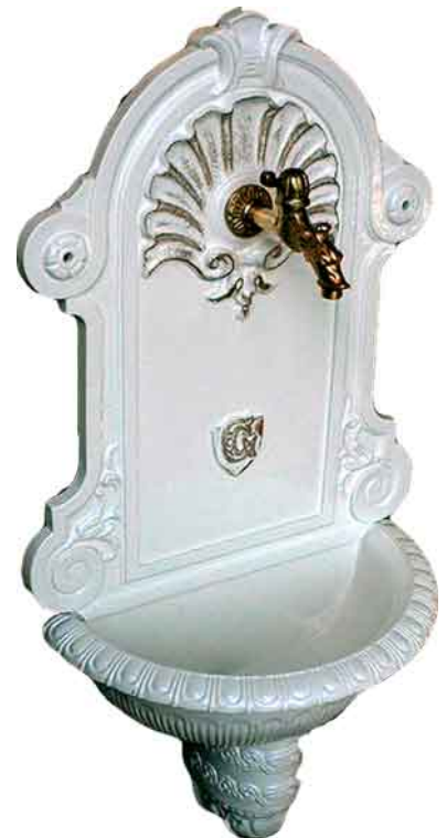
NWB-05 weiß/antik gold