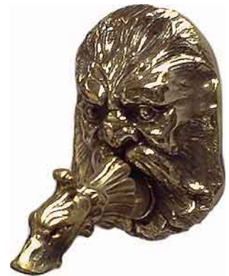
NWH-01 Renaissance Auslauf (Auslauf ohne Ventil)