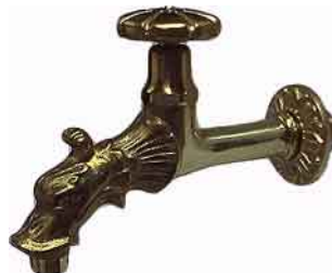
NWH-04 Drachen-Hahn mit Hand- rad-Ventil