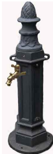
NBR-04 grau Poller GP-02 grau, mit Wasserhahn als Wasserzapfstelle. (Abschraubbarer Pinienzapfen).