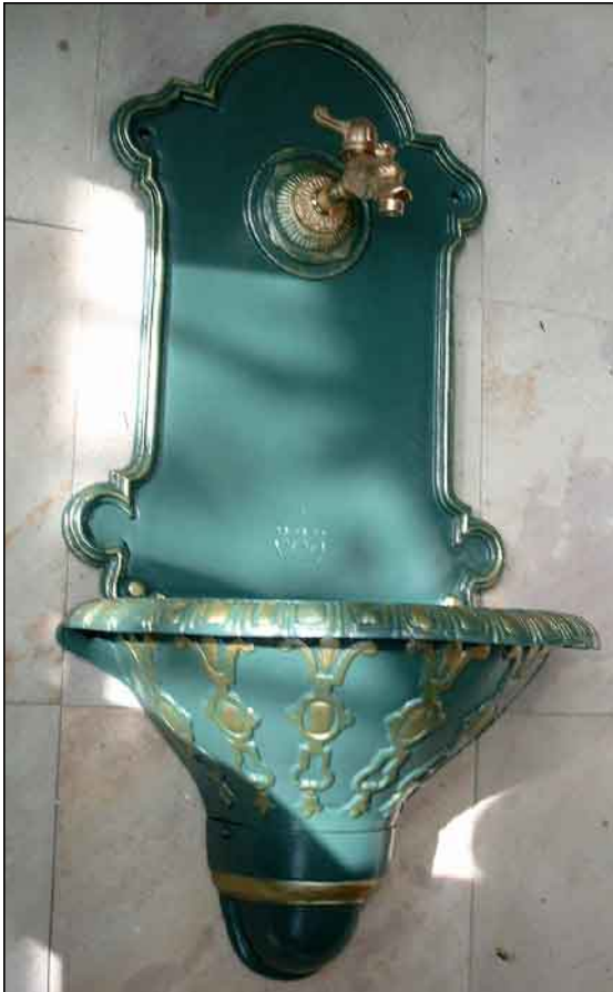
NWB-02 kieferngrün/antik gold

Zum Händewaschen im Innenbereich geeignet.