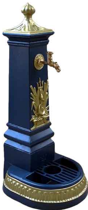
NBR-03 blau/gold (abschraubbares Dach).