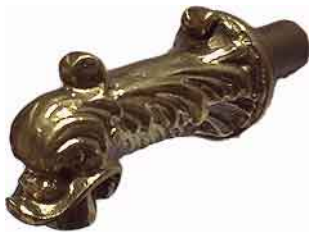
NWH-02 Nostalgie-Wasserspritze (Auslauf ohne Ventil)