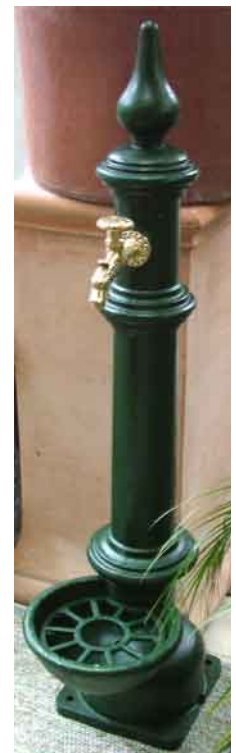
NBR-06 grün Schlanker Standbrunnen, mit Wasserhahn als Wasserzapfstelle. Komplett mit Wasserhahn und eingebauter Verrohrung. (Abschraubbare Spitze).