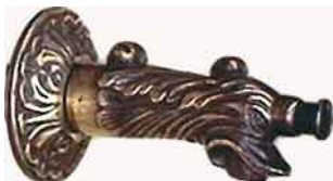
NWH-20 Drachen-Hahn mit Druckknopf Das Wasser läuft nur, solange der Knopf gedrückt wird. Verwendung hauptsächlich im öffentlichen Bereich.