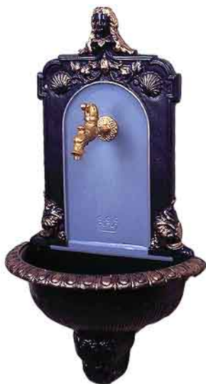
NWB-03 stahlblau/ taubenblau/gold

Alle Waschbecken, Brunnen und Handschwengelpumpen sind in allen RAL-Farben ein- oder zweifarbig nach Ihren Wünschen lackiert oder unbehandelt zum Selbstlackieren lieferbar!